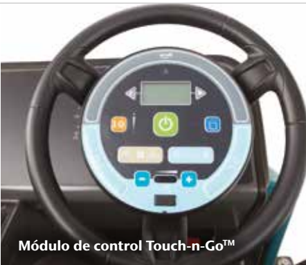
Módulo de control Touch-n-Go™

▶ El módulo de control Touch-n-Go™ con botón de inicio 1-Step™ que permite a los operarios acceder rápidamente a todos los ajustes sin retirar las manos del volante.