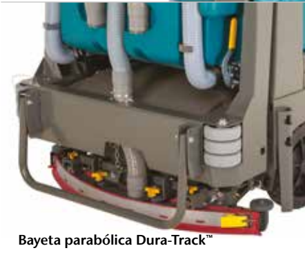
Bayeta parabólica Dura-Track™

Tejadillo de protección que previene que el operario sea golpeado por objetos que salgan despedidos.