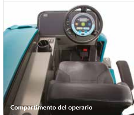
Compartimento del operario