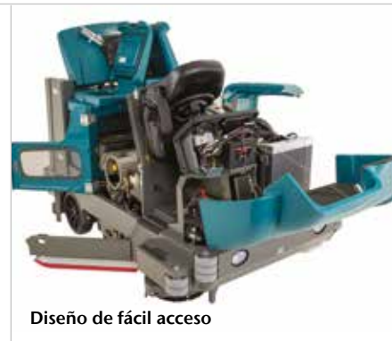
Diseño de fácil acceso

▶ Puntos de contacto de mantenimiento amarillos fáciles de identificar permiten ahorrar tiempo y dinero en las tareas rutinarias de mantenimiento.