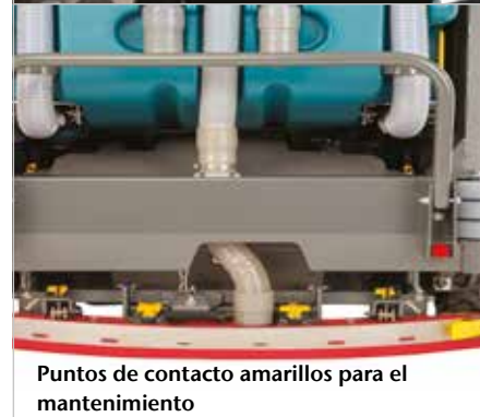
Puntos de contacto amarillos para el mantenimiento