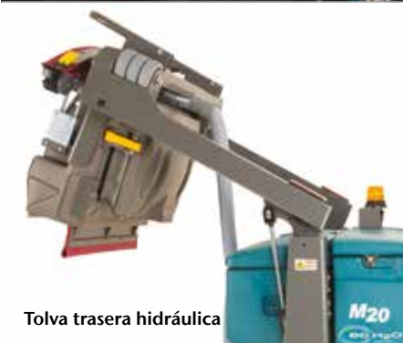
Tolva trasera hidráulica