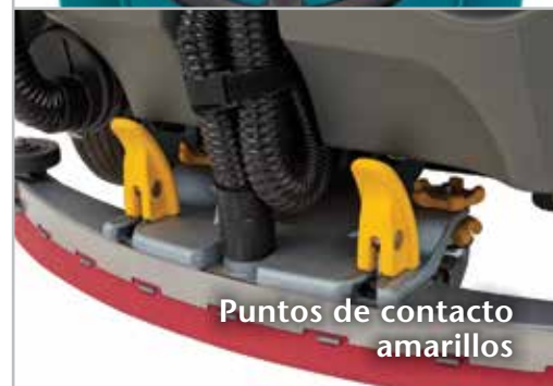
Puntos de contacto amarillos